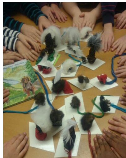
Bild tagen vid kreativt skapande med lågstadieklass. Vi gör troll och pratar om hur man är en bra kompis

Tillsammans hjälps vi åt att göra egna troll av kottar, tyg och skinnbitar.