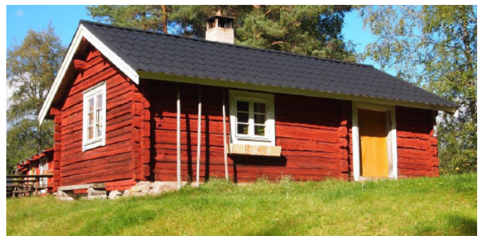
Illustration Täpp Marit

2013 debuterade Täpp Lars som barnboksförfattare men boken Trollgudet i fäboden.